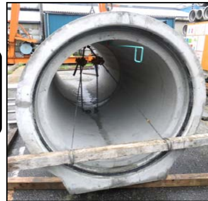
③レバーブロックで左右均等に引き込む