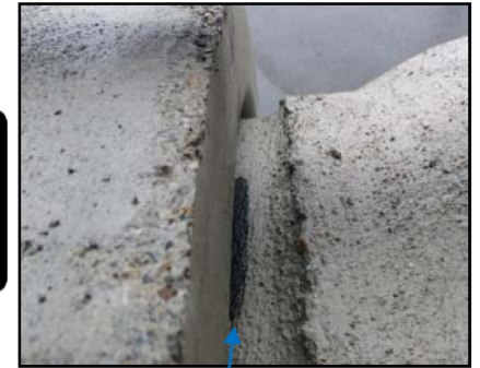
④メス端部が差し込み限界線の中に収まれば完了です