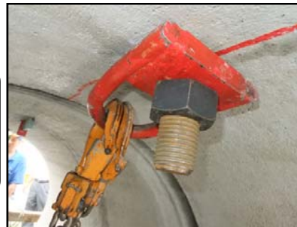
②引込用金具にフックを掛ける